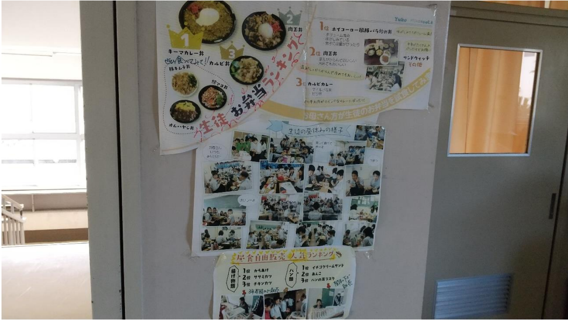
↑販売されている屋食のお弁当について