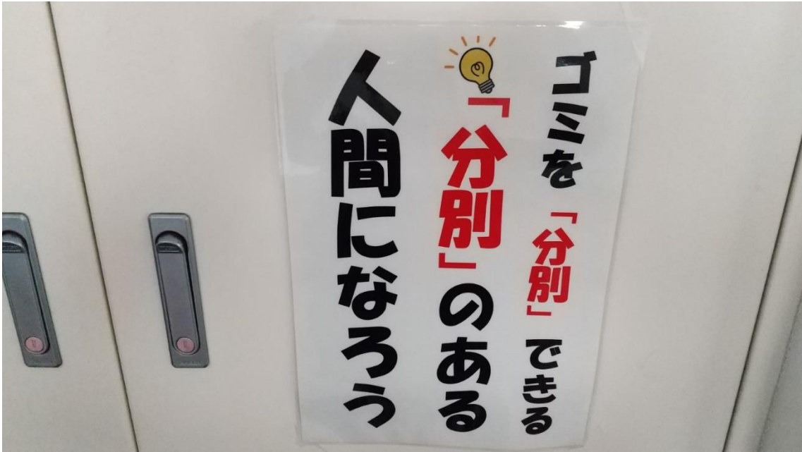
↑ 「ぶんべつ」と「ふんべつ」