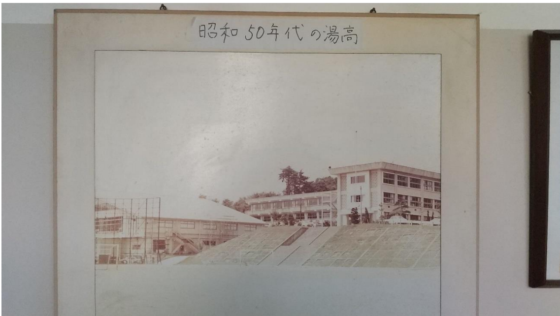
↑ 昭和50年代の湯本高校の様子