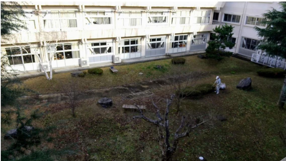
↑学び舎の環境整備に汗を流す事務部の職員