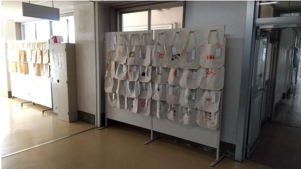
↑美術の授業（2年）の作品が展示されております。版画「シルクスクリーン」（元気になるエコバッグをテーマにイラストを考えました。）の作品です。