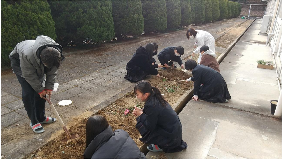
↑ 保健室掃除担当の1年生が花壇（保健室前）の玉ねぎを掘り起こしております。