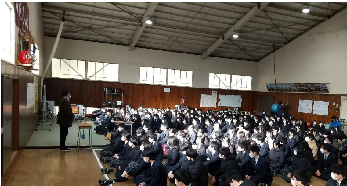
↑ 1月31日（火）、格技場において自宅学習前集会（3年生）が行われました。