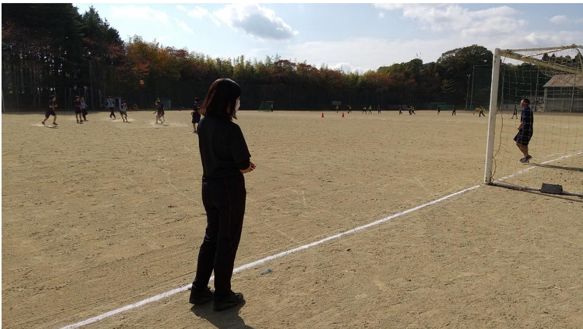
↑体育の授業（サッカー）