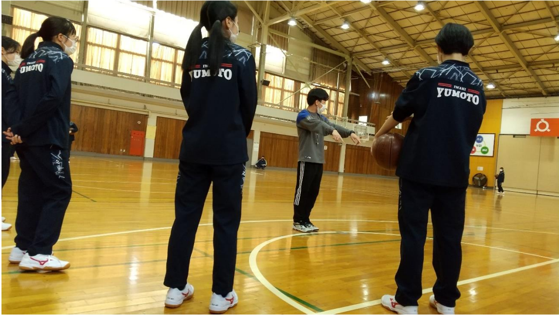
↑体育（バスケットボール）の授業