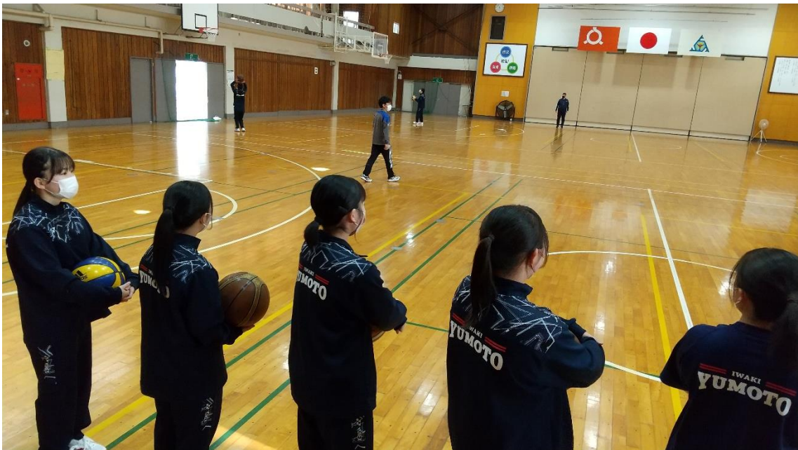
↑体育（バスケットボール）の授業